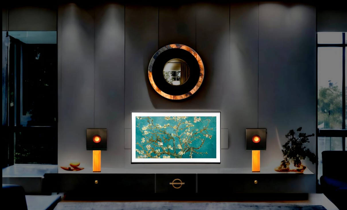
Lustro z podświetlonym kwarcytem Patagonia / Oświetlenie Shadow Light